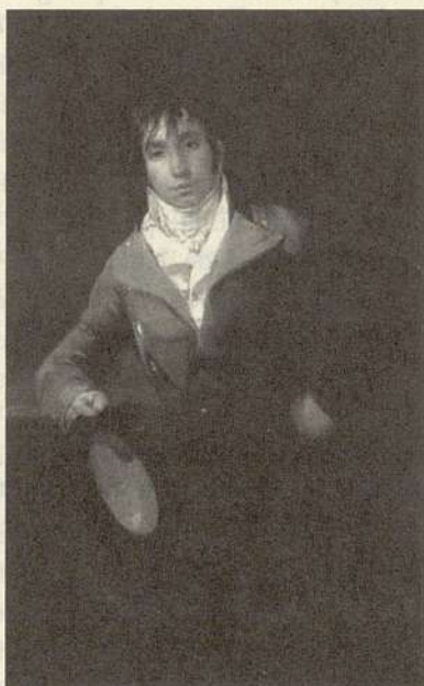
Bartolomé Sureda y Miserol retrato realizado por Goya.

realizó múltiples litografías. Sureda está vinculado a la provincia de Guadalajara por que fue director de la Real Fábrica de Paños de Guadalajara en 1824, donde introdujo nuevos diseños en máquinas de hilar. Fue además, en 1803-1808 director de la Real Fábrica del Buen Retiro y de La Real Fábrica de Porcelana de la Moncloa en 1821-1829.