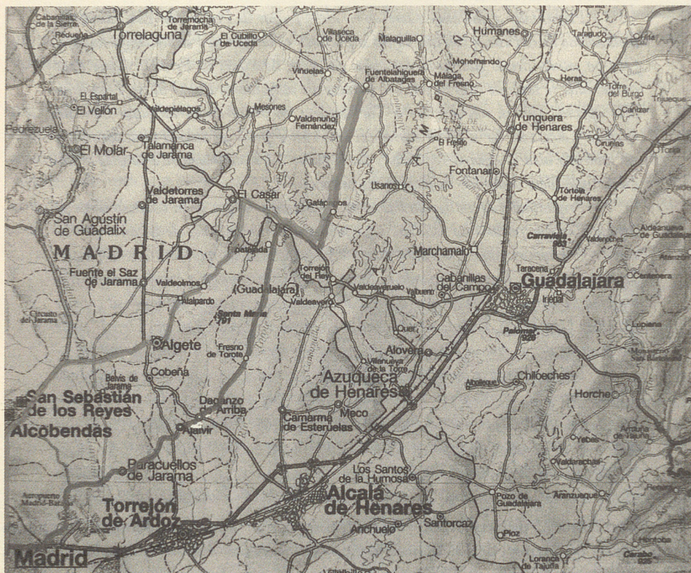
Azul = Itinerario de Fuentelahiguera a la cárcel de Madrid Naranja = Itinerario de Madrid a la cárcel de Fuentelahiguera

El superintendente hechas las indagaciones oportunas y no encontrando nada condenable, devuelve el preso a la justicia de Fuentelahiguera para que ellos lo juzguen, y advirtiéndolos que en lo sucesivo eviten remitirle presos como el que se trata.