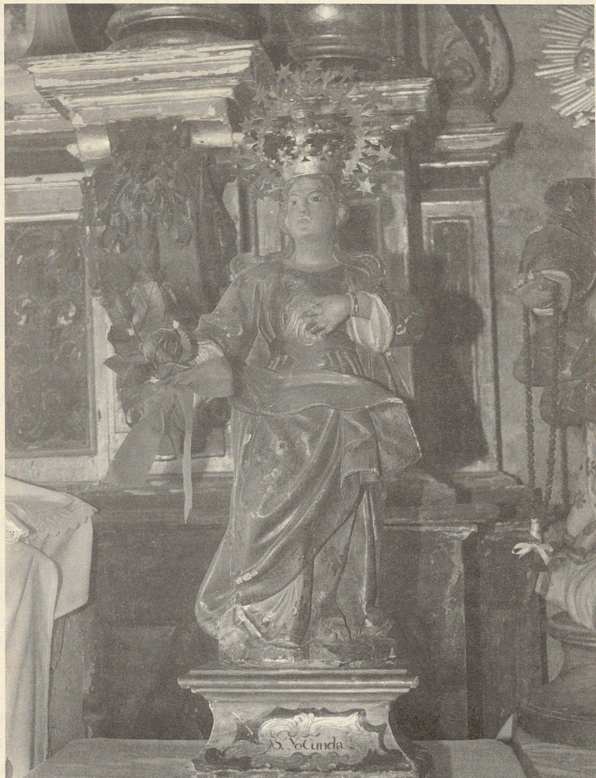
Fig. 4.— Talla barroca de santa Yocunda. Ermita de la Soledad. Bujarrabal. Obsérvese la cartela de la peana.

Veremos más adelante que dicha peana fue construida en el siglo XIX.