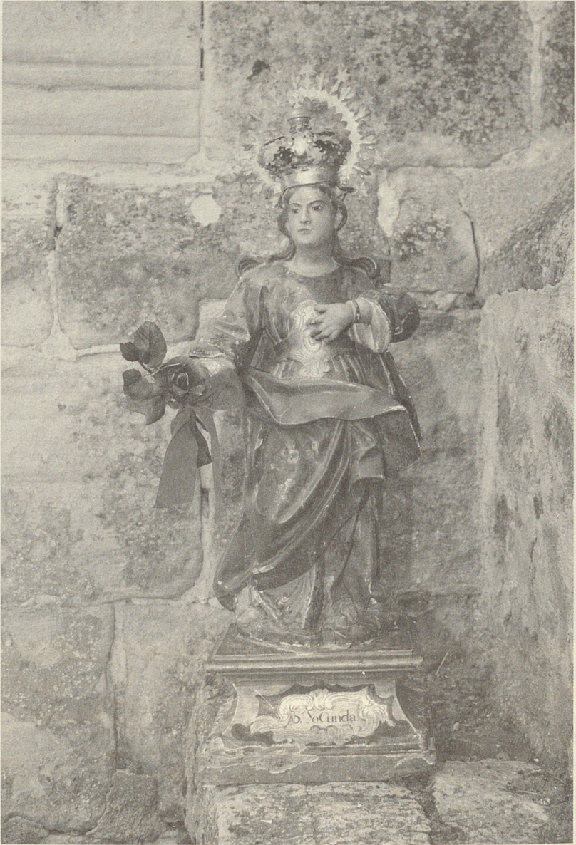
Fig. 5.— Imagen «de bulto» de santa Yocunda. Ermita de la Soledad. Bujarrabal.

Es la única imagen que conocemos de santa Jocunda que representa a ésta, al igual que sucede en el grabado, con su mano izquierda a la altura del pecho, vistiendo una ropa verde adornada con flores de ocho pétalos, que recoge a la cintura con una especie de correa dorada que se ensancha en el centro de la obra. Una túnica roja adornada con ramilletes de flores y numerosos pliegues, cubre parte de su vestimenta. A los pies sandalias con tira de oro.