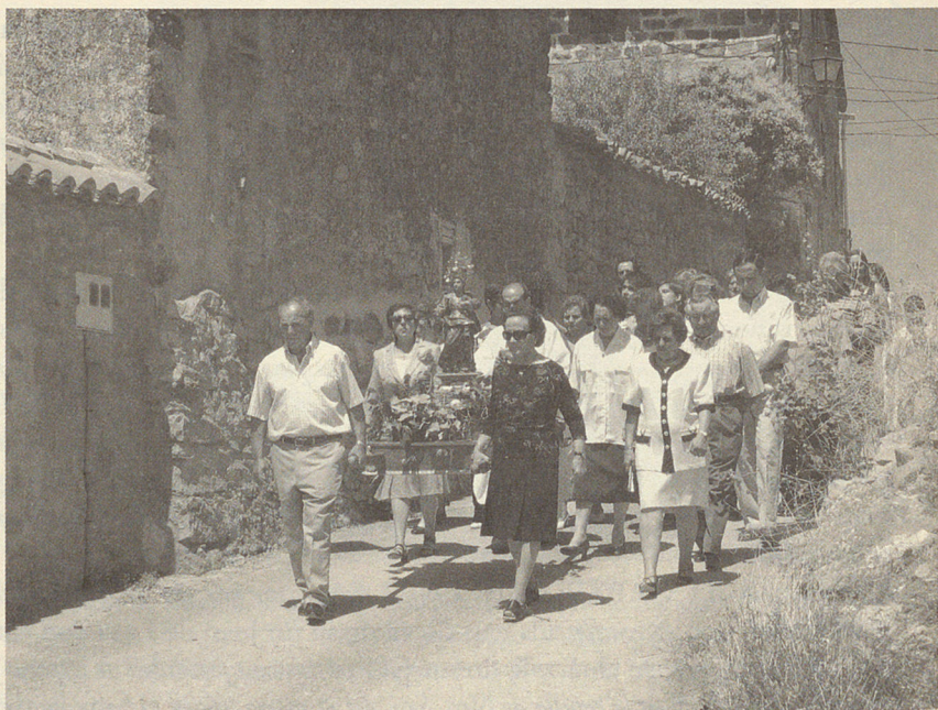
Fig. 7.– Procesión de la imagen de santa Yocunda por las calles de Bujarrabal (30 de julio de 2005).

«... el pueblo anda en preparativos ante la fiesta mayor que se avecina: la de Santa Yocunda; una bienaventurada que el pueblo venera como patrona, y de la que uno lamenta no poder contar más noticias acerca de su vida y virtudes» 23