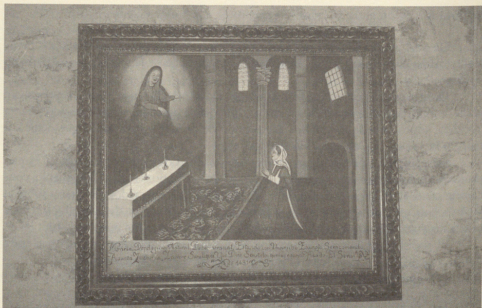
Fig. 2.— Copia del exvoto realizada por «Juanas» en 1997. Ermita de la Soledad. Bujarrabal. (Fot.: J.A. Marco Martínez).

Existe una copia realizada por Juanas (vecino de Bujarrabal), en 1997.