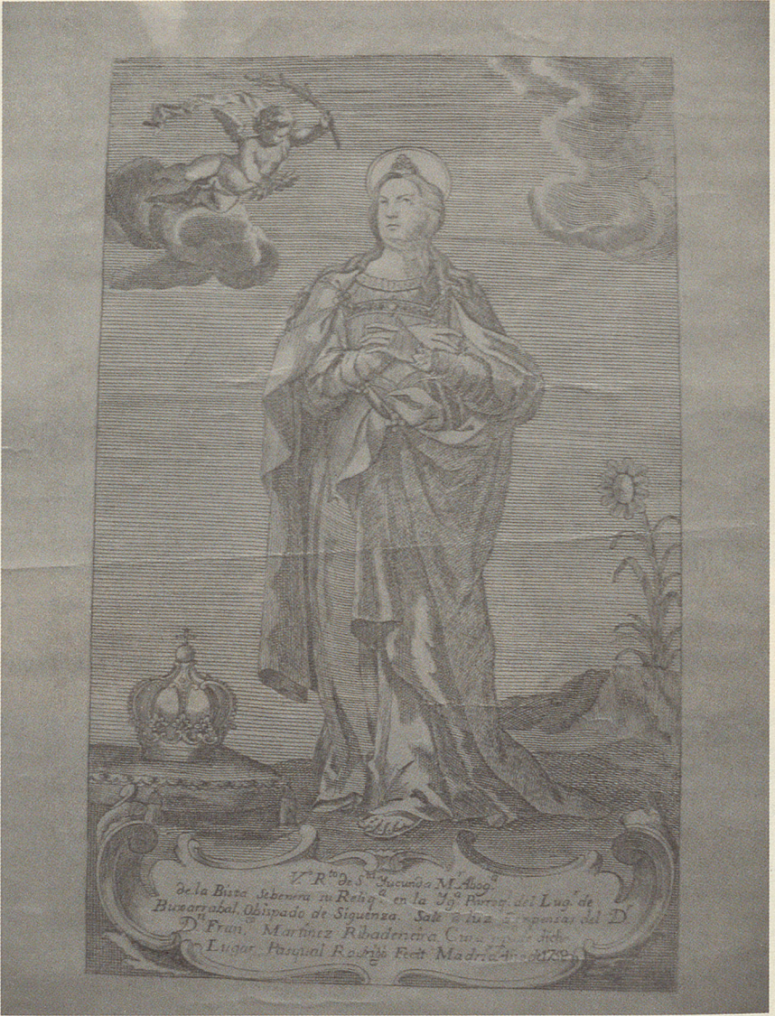
Fig. 3.— Grabado de santa Yocunda (Pascual Rodrigo, 1758).