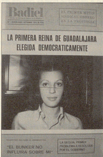
Portada Badiel (1976), n° 1, Septiembre 1976.

En la cabecera figura el nombre de Badiel . Incluye el subtítulo Revista de Información General de la Provincia . El primer número se publica el 1 de septiembre de 1976. Sólo