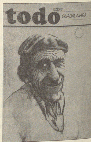
Portada Todo sobre Guadalajara (1985), nº 4, 1985.

La información se distribuye en las siguientes secciones: Perfil, «El pintor y su obra», Artesanía, Calendario, Libros, Joven, «Teletipo cultural», Rock, Gastronomía, Colaboración, Radio, Rutas e Información 27 . A tenor de los escasos datos disponibles y las pocas referencias que hemos encontrado sobre la publicación, parece que se trata de una iniciativa efímera, con base empresarial poco sólida. En el editorial del primer número se puede leer: «Nacemos a Guadalajara con un titular que no queremos pretencioso, pero sí con pretensiones. Nosotros en este Todo sobre Guadalajara queremos expresar la pretensión de informar de cuanto alguna relevancia tenga para todos los lectores potenciales de nuestra publicación» 28 .