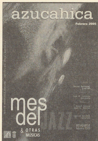
Portada Azucahica (1981), nº 134, Febrero 2005.