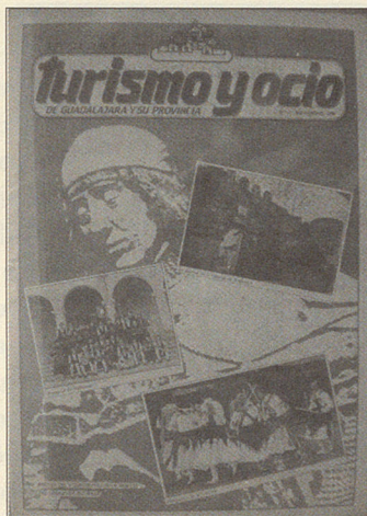
Portada Turismo y ocio de Guadalajara (1986), n° 2, Noviembre 1986.