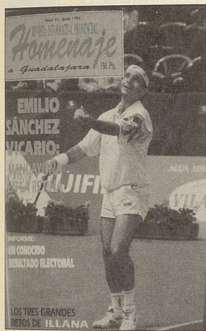
Portada Homenaje a Guadalajara (1988), n° 41, Junio 1993.

Se publica con el título Homenaje a Guadalajara e incluye el subtítulo: Revista Informativa y Publicitaria de la Provincia de Guadalajara . El número 0 se publica en diciembre de 1988 y el número 43 se publica en junio de 1993. La redacción y administración se ubican en dos sedes diferentes. Primero en la calle Felipe Solano Antelo, número 8C. Posteriormente, en la calle Sigüenza, número 7. Se imprime en Gráficas Minaya S.A. 48 . Se vende en quioscos de Guadalajara al precio de 125 pesetas. Habitualmente tiene 36 páginas. Se imprime en formato de 23x32 centímetros y a partir del número 24 se edita en formato DIN-A4 (21x30). Las informaciones se distribuyen en la página a 4 columnas. Se edita en papel couché y la portada y la contraportada son a todo color.