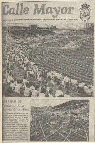
Portada Calle Mayor (1980), nº 70, Julio-Agosto 1987.

tros. Disminuye dos centímetros a partir del número 3. Con el número 8 cambia de formato y papel. El número 10 17 se edita ya en formato revista. El número 16 se publica en papel couché y con color. « Calle Mayor evolucionaba al ritmo que lo hacía la ciudad. Se cambiaron formatos, se incluyó el color en su cabecera y en sus textos, y se abrieron sus páginas al mundo de la imagen», explica la periodista Ana del Campo 18 .