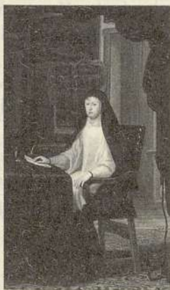
Mariana de Austria

A muy grandes rasgos estos son los antecedentes de la guerra: