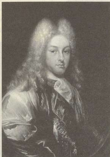
Felipe V duque de Anjou

El 1 de Noviembre de 1700 muere Carlos II con 38 años. (1)