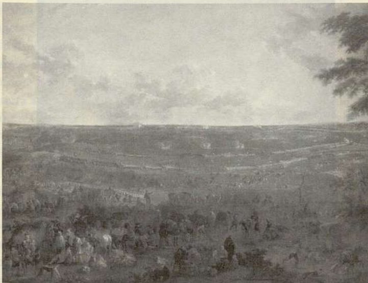
Batalla de Villaviciosa. Kunsthistorisches Museum.Viena

Estas dos victorias fueron decisivas en el devenir de la Guerra. El general Starhemberg se dirigió a Barcelona donde llegó el 6 de Enero de 1711, las tropas de Felipe V fueron tras él recuperando el reino de Aragón.