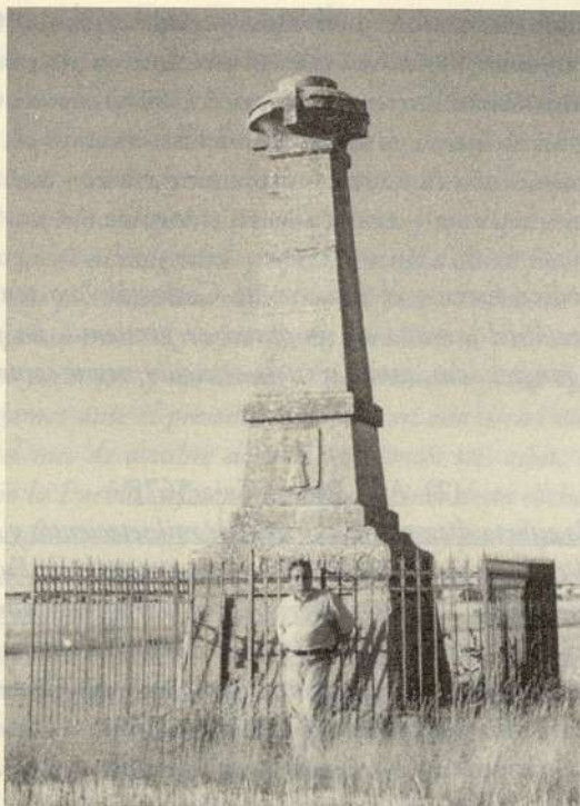
Monumento conmemorativo de la batalla de Villaviciosa

En Enero de 1712 comenzaron las negociaciones en Utrecht entre Francia e Inglaterra. Esta se comprometía a reconocer a Felipe V como rey de España a cambio de conservar Gibraltar y Menorca y poder comerciar en las colonias españolas en America. Felipe V renuncia a sus derechos al trono francés lo cual favorece la negociación. El 27 de Marzo de 1713 España e Inglaterra firman la paz, en Abril lo hace con Francia, y después lo harían las otras potencias. Este es el famoso tratado de Utrecht que pone fin a la sangrienta guerra de Sucesión: