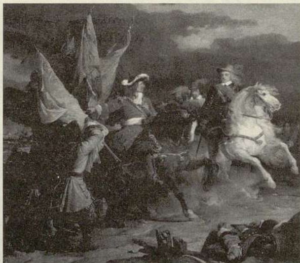
El duque de Vendome entrega a Felipe V los estandartes capturados al ejército aliado después de la batalla. Óleo de Juan Alaux. Museo de Versalles. París