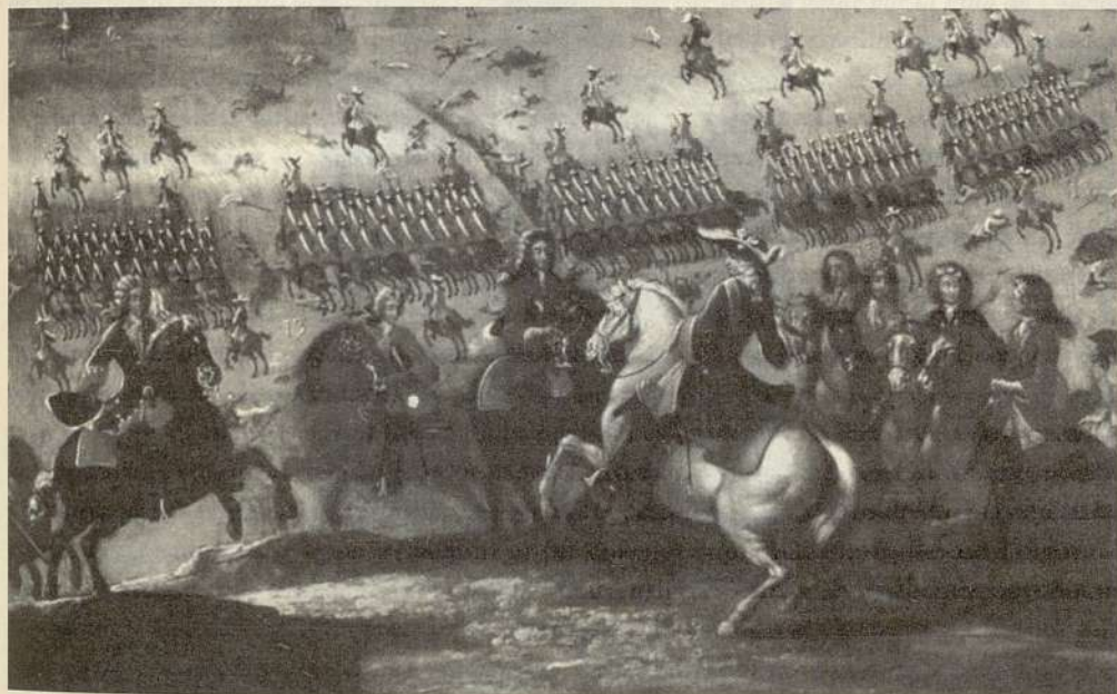
Batalla de Almansa

allandose acampado dos leguas distantes desta dicha villa y lo corta y esausta de medios que esta dicha villa se alla, ante quien pida remate de la cantidad de arina que se le a repartido, pudiendo pida rebaje de setenta fanegas, de sesenta, de cincuenta, y mas todo lo que pudiere, aciendo relacion de todo lo referido atendiendo que para la paga de la cantidad que ajustare, se alla esta dicha villa con mui cortos medios para la paga como dicho es”.