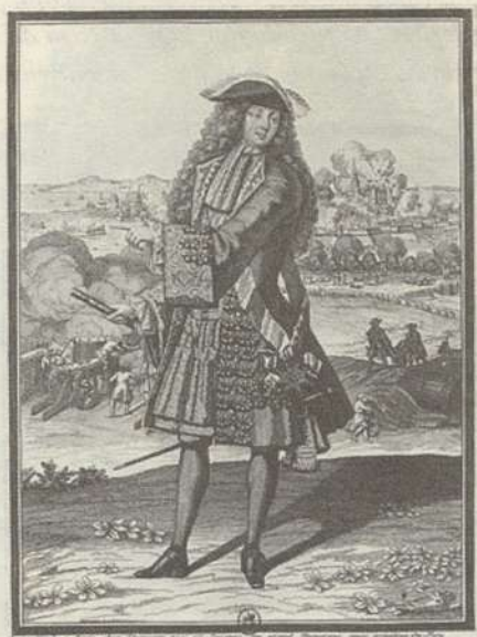
Louis Joseph Duc de Vendôme General des Armées, Commandant des Armées du Roy en Catalogne. Fils de Louis Cardinal Duc de Vendôme et d'Antoinette Mancini, né en 1732.

hombres de a caballo e infantería cruzan las poblaciones de Marchamalo, de Usanos, y se dirigen hacia Fuentelahiguera, una vez allí la saquean en su totalidad