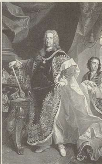
El archiduque Carlos de Austria

Felipe de Anjou es nombrado rey de España el día 24 de Noviembre de 1700, pero Austria no lo acepta. Desde este momento se inicia el enfrentamiento entre los dos bloques, uno formado por Francia y España, y el otro por Austria, Holanda, Inglaterra, Portugal, y el ducado de Saboya. No sólo está en juego el reino de España sino también la hegemonía Europea.