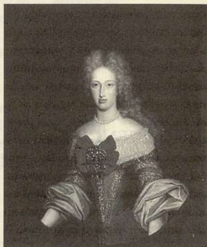
Mariana de Neoburgo

Carlos con 18 años se casa con María Luisa de Orleans sobrina de Luis XIV de Francia, pero ésta muere en 1689 sin darle descendencia, a continuación se casa con Mariana de Ausburgo. Carlos por su incapacidad para gobernar puso el ejercicio del poder en manos de su esposa Mariana, quien se rodea de consejeros alemanes, por lo que una gran parte de la nobleza que está en contra pide al consejo de estado su destitución, y tampoco le da hijos.