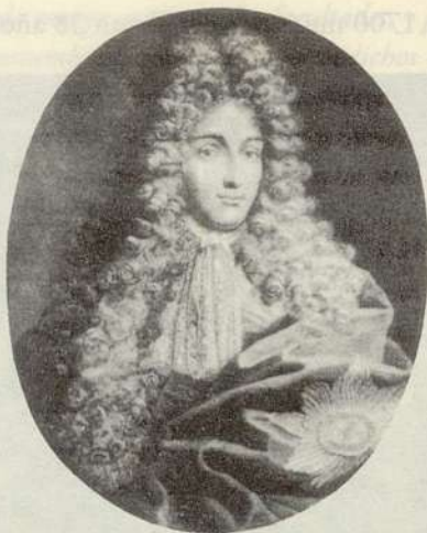
James Fitzjames, primer duque de Berwick

También las incursiones del ejército invasor en este caso de portugueses, como ocurrió en Fuentelahiguera, quien mejor lo cuenta es un documento (2) de fecha 31 de Octubre de 1706 por el que se nombra una comisión, que pida al rey que les perdone los impuestos de ese año por no poder pagarlos, debido a los graves saqueos padecidos por los dos ejércitos, el de los portugueses y el de los españoles: