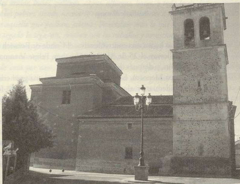
Iglesia de Fuentelahiguera (cara norte)