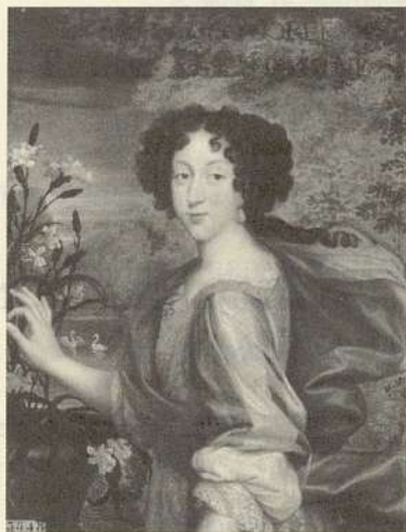
María Luisa de Orleans

Austria mi muy chara, y amada muger con todas las facultades, y poder, que conforme a las leyes fueros, y privilegios, estilos y costumbres de cada uno de los dichos mis regnos, estados y señorios”