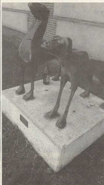
FOTO 4. Una de las esculturas del Museo al Aire Libre de Alcalá de Henares.