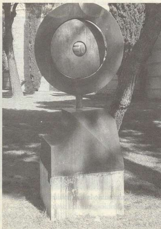
FOTO 3. Vista al principio del recorrido, Museo al aire libre de Alcalá de Henares.