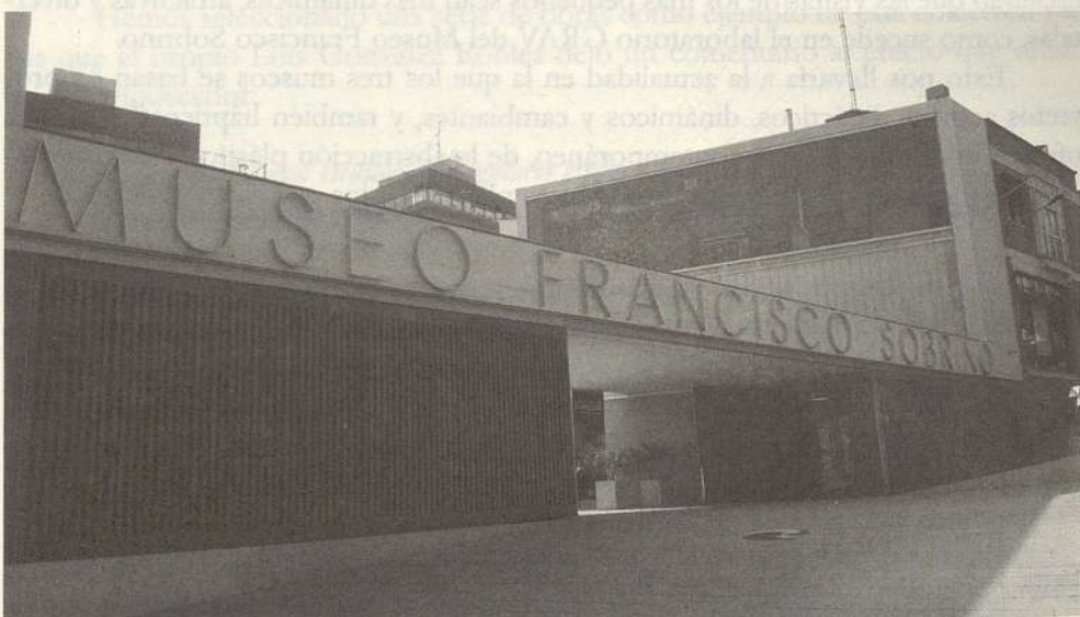
FOTO 1. Fachada exterior del Museo Francisco Sobrino. Cuesta del matadero, Guadalajara.

WITTKOWER, Rudolf, La escultura: procesos y principios . Madrid, 1980.