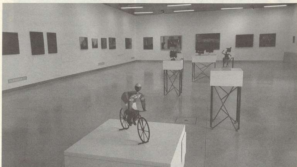
FOTO 6. Interior del Museo de Arte Iberoamericano de la Universidad de Alcalá, vista general de la sala de Luis González Robles.