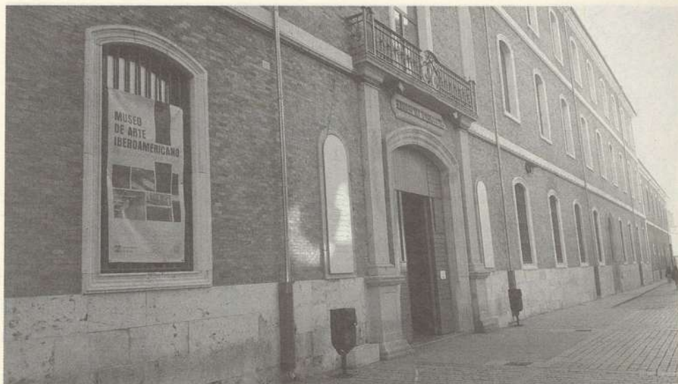
FOTO 5. Fachada del Museo de Arte Iberoamericano de la Universidad de Alcalá donde se aprecia la forma de cuartel, al que estuvo dedicado antes el edificio.