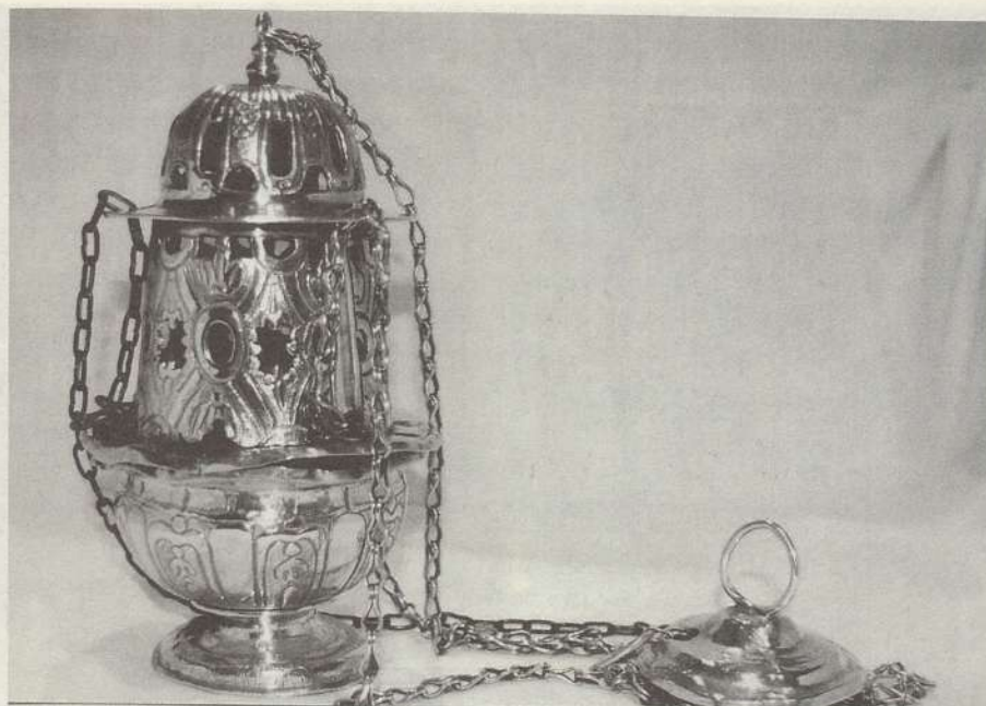
LÁMINA VII. Incensario. ¿Guadalajara? Medios del siglo XVIII. Parroquia de la Purísima Concepción de Valdenoches.