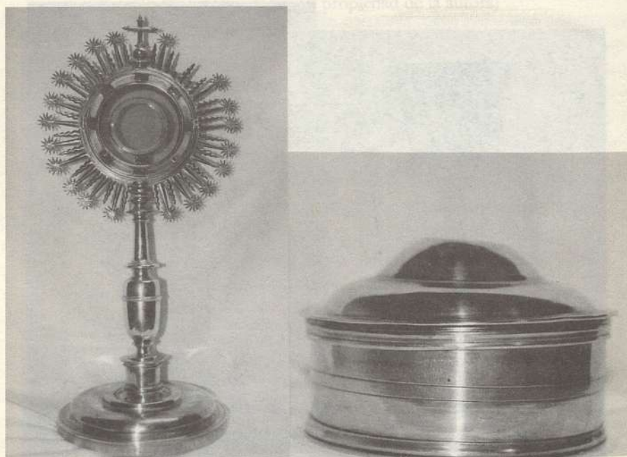
LÁMINA VI. Custodia. ¿Alcalá de Henares? Medios del siglo XVII. Parroquia de San Sebastián mártir de Pioz. Portaviático. Castilla. Finales del siglo XVII principios del XVIII. Parroquia de la Purísima Concepción de Taracena.