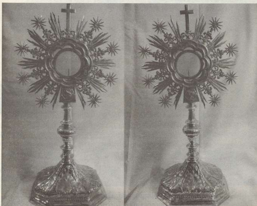
LÁMINA VIII. Custodia. Castilla ¿Guadalajara? Medios del siglo XVIII. Parroquia de la Purísima Concepción de Taracena.