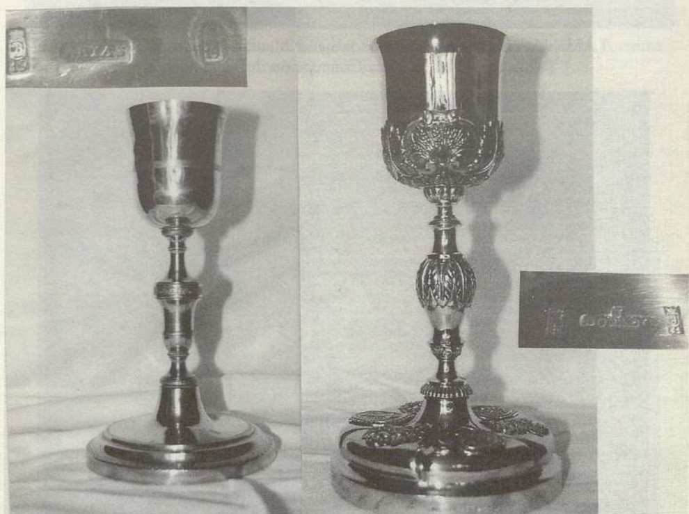
LÁMINA X. Cáliz. Madrid. Diego Arias. 1819. Parroquia de la Purísima Concepción de Iriepal. Cáliz. Madrid. José Dorado. 1861. Parroquia de San Sebastián mártir de Pioz.