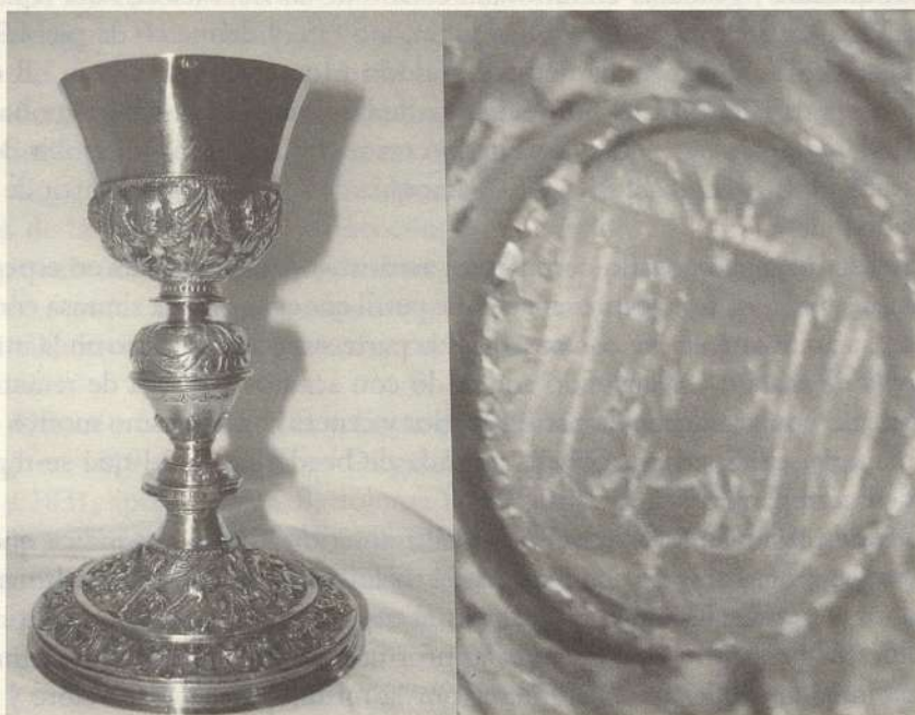
LÁMINA II. Cáliz ¿Alcalá de Henares? Tercer cuarto del siglo XVI. Parroquia de la Purísima Concepción de Taracena.