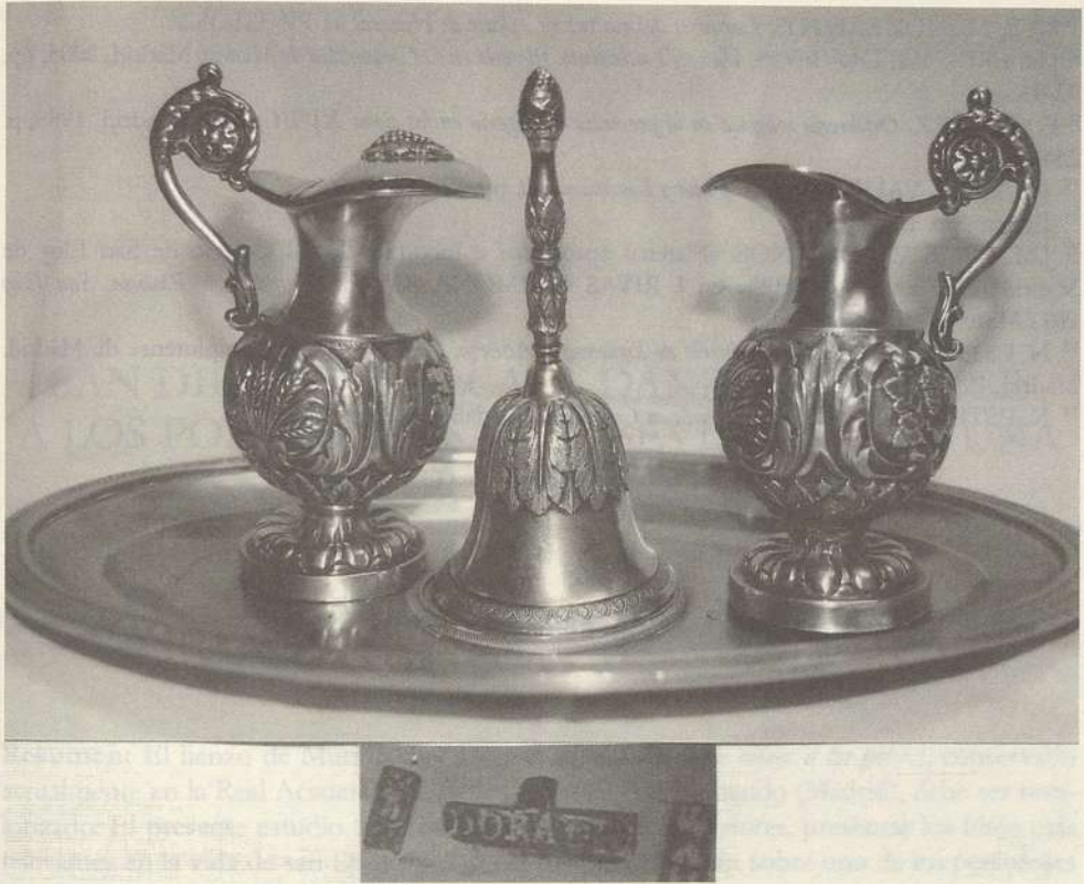
LÁMINA XI. Vinajeras con salvilla y campanilla. Madrid. José Dorado. 1861. Parroquia de San Sebastián mártir de Pioz.