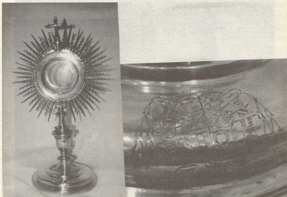
LÁMINA V. Custodia. Castilla. Medios del siglo XVII. Parroquia de la Purísima Concepción de Valdenoches.