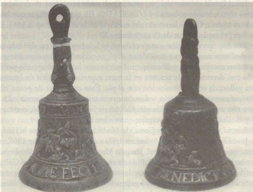
LÁMINA I. Campanilla. Malinas. Jan van den Eynde. 1533. Campanilla. ¿Malinas? Medios del siglo XVI. Parroquia de la Purísima Concepción de Taracena.