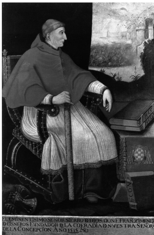
Retrato de Cisneros con leyenda alusiva a la fundación de la Cofradía de la Concepción. Eugenio Caxés, s. XVII.

A instancias de Cisneros, Adriano VI dio la aprobación pontificia el 31 de julio de 1522, cinco años después de la muerte del cardenal, recomendando su instauración en otros lugares. Entre sus principales cometidos se encontraba el de pedir limosna los sábados para los pobres vergonzantes y encarcelados (Labarga, 2004: 27). Esta bula tuvo una importante repercusión, estableciéndose nuevas cofradías.