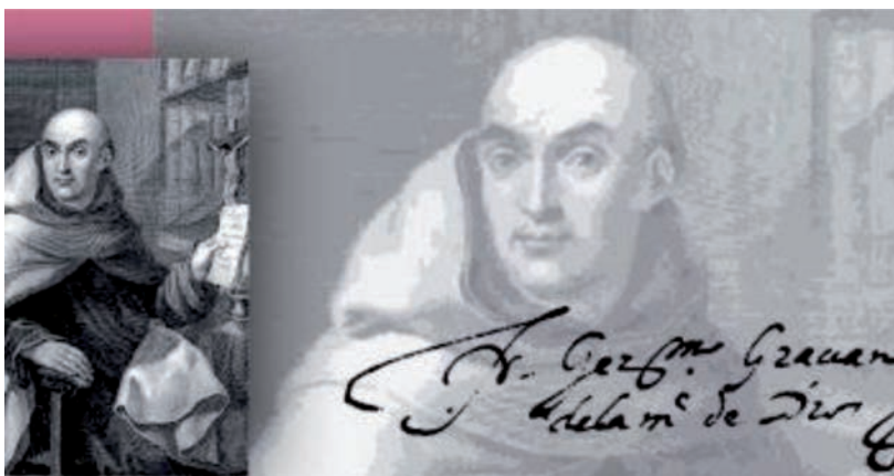
Foto N°1.- Fray Jerónimo Gracián de la Madre de Dios y su firma autógrafa.