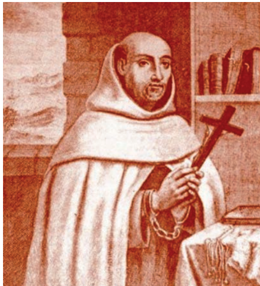
Foto Nª 3 Fray Jerónimo ataviado como carmelita y atributos: la cruz, como seguidor de la de Cristo, los libros, como prolífico escritor y celoso predicador, cadenas físicas y morales de su martirio como apresado, en las muñecas y cilicio de penitencia sobre la mesa. El paisaje de la ventana es poco apreciable.