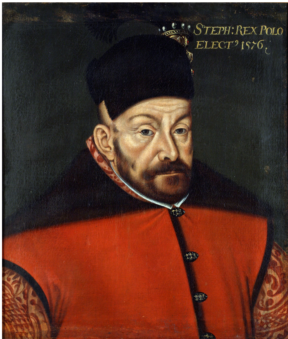
Figura 4. Esteban Bathory. Rey de Polonia (1576-1586).