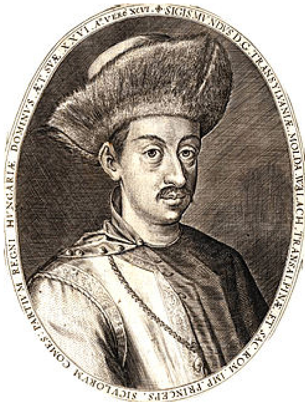
Figura 3. Segismundo Bathory, Príncipe de Transilvania.