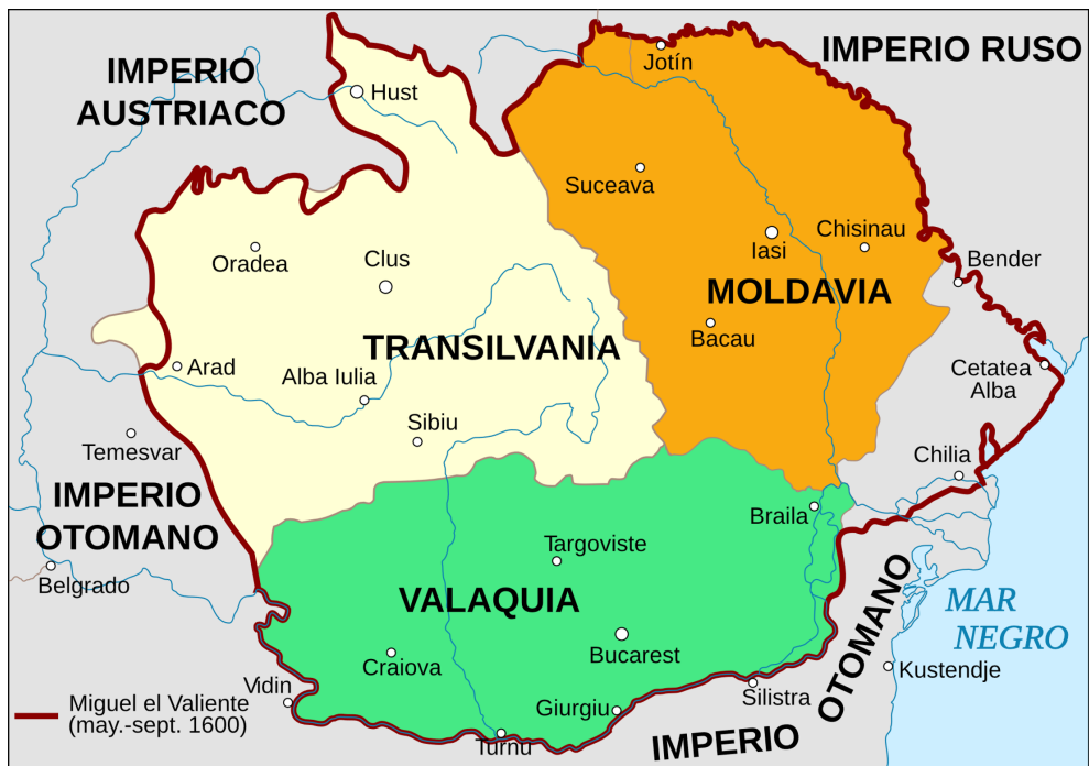
Figura 2. Voivodatos en Rumanía en 1600.