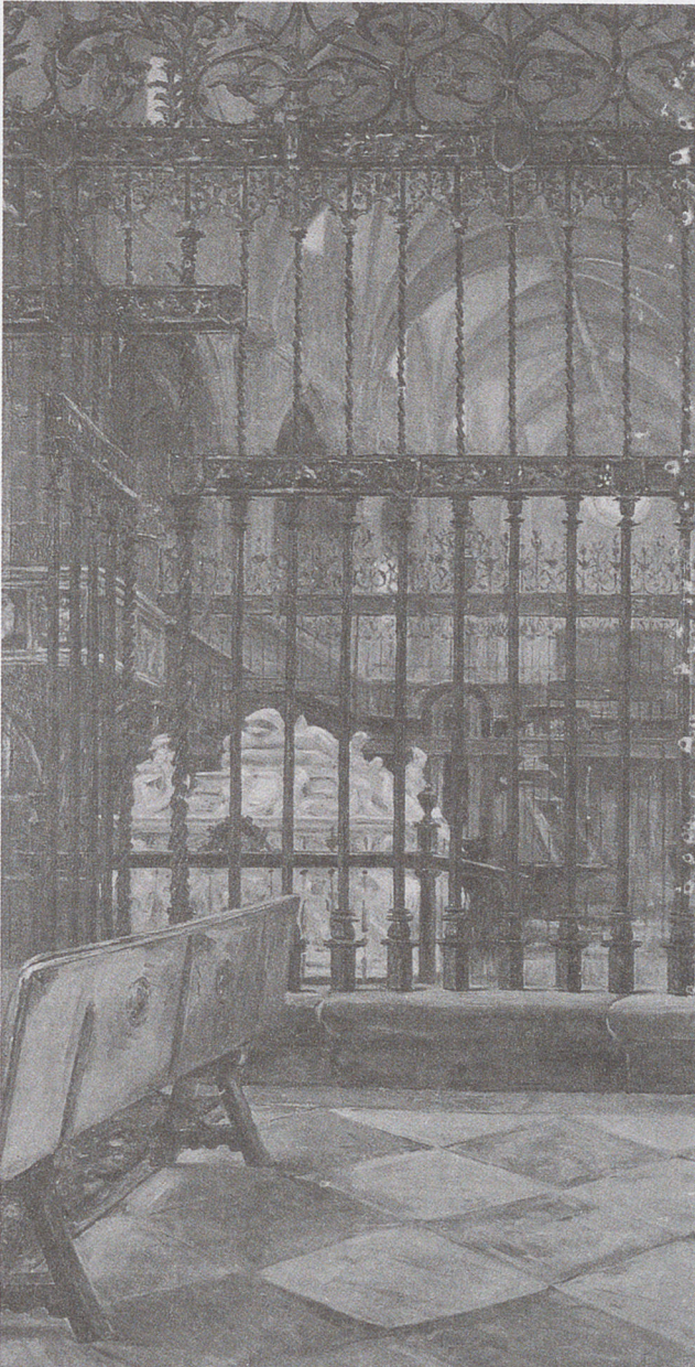
Figura 2. "Reja de la Iglesia Magistral". Óleo sobre lienzo, Félix Yuste, donde se representa una parte de la capilla mayor con el asiento del corregidor, el basamento de piedra de la reja y uno de los bancos de madera donde se sentaba la corporación municipal