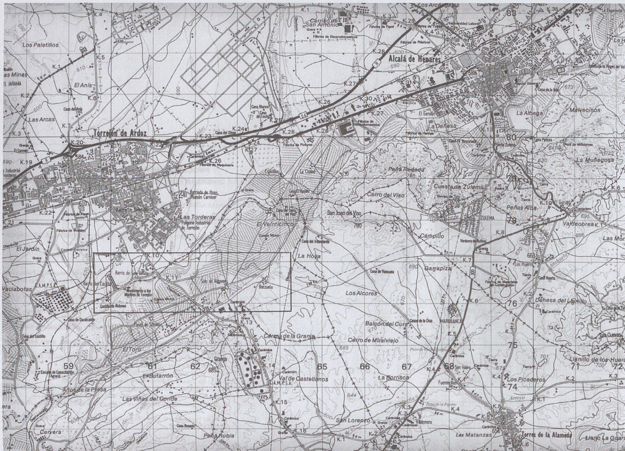
Fig.1. Zona del estudio en el mapa general serie L.E. 1:50.000 20-22 (560) Alcalá de Henares, de la Cartografía Militar de España.