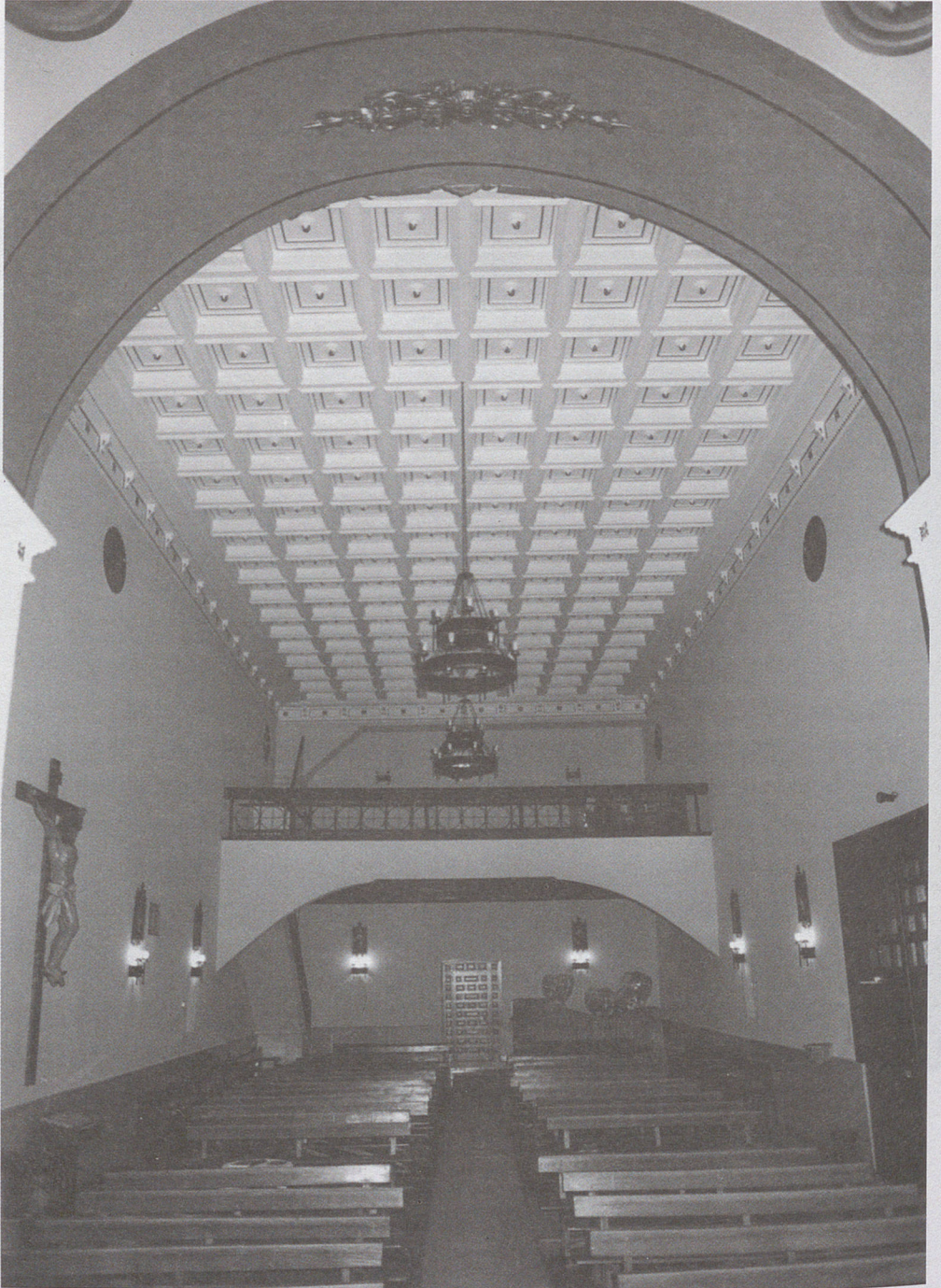
■ Falso techo en el que en 1774 se ocultó el artesanado de la Iglesia de Perales de Tajuña.