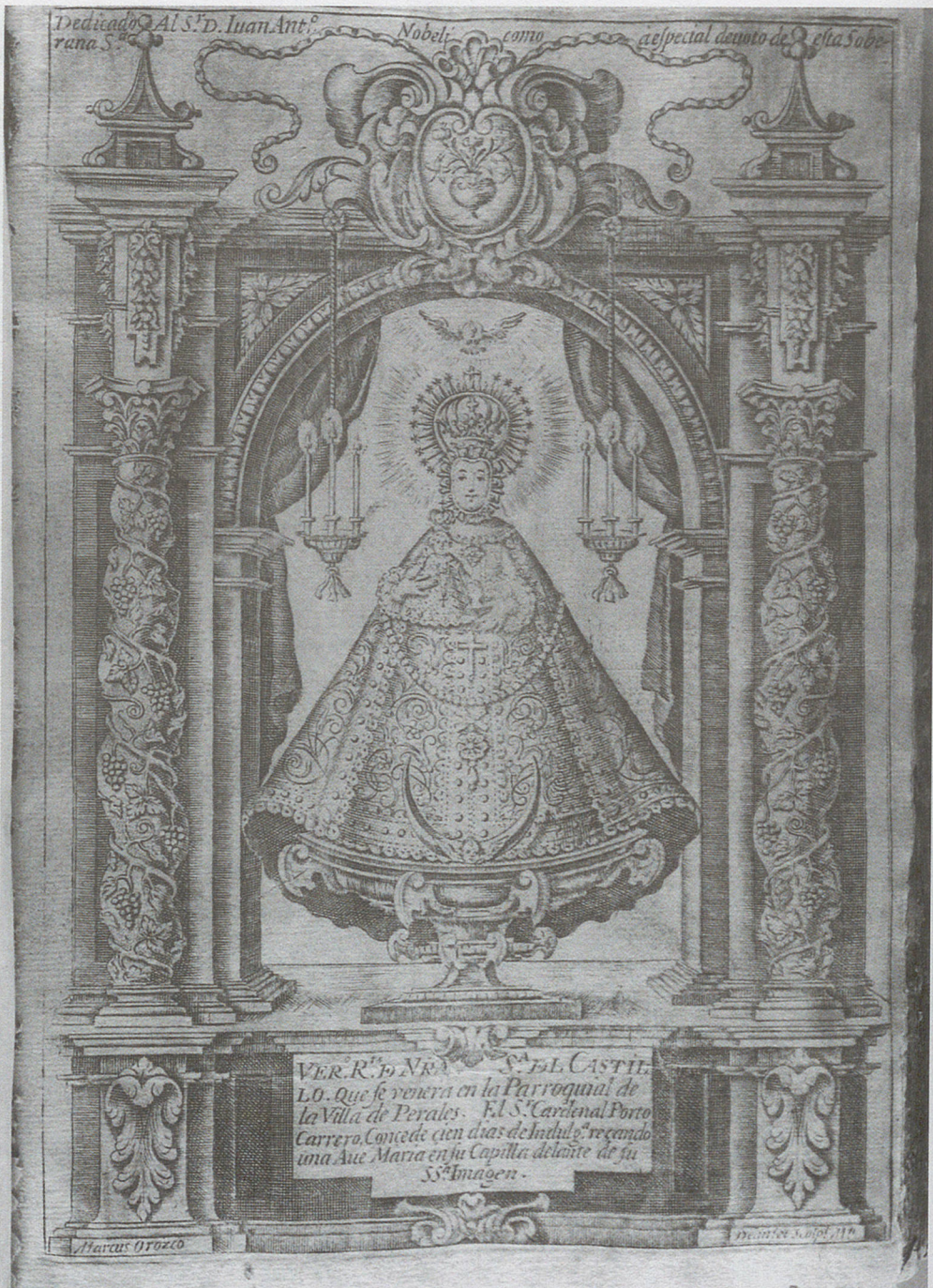
■ Grabado del siglo XVIII que representa a la Virgen del Castillo y el Retablo Mayor.