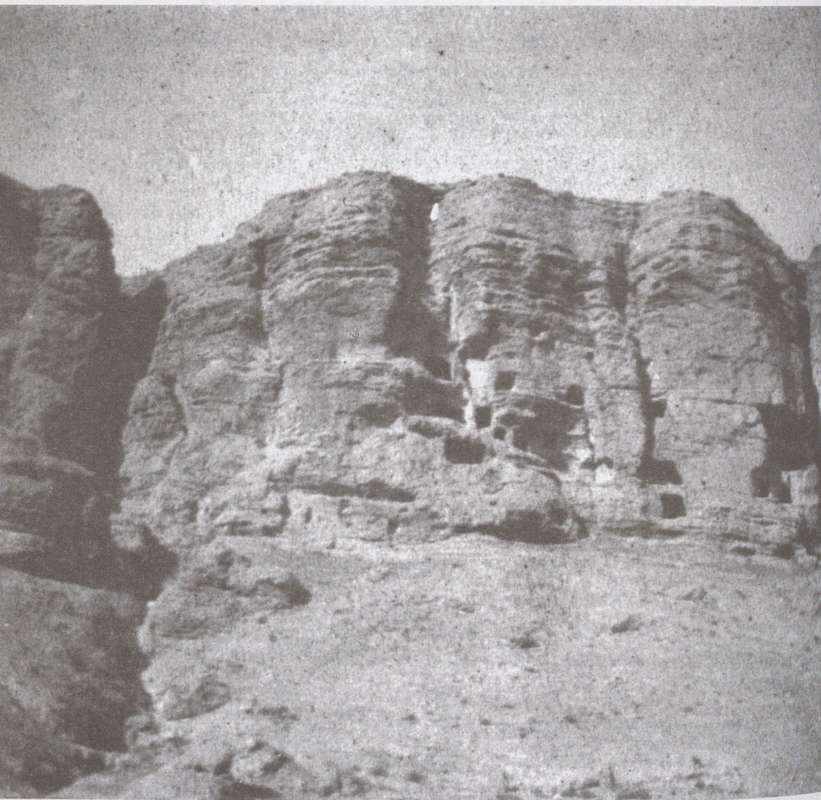
■ Risco de las cuevas de Perales de Tajuña (Madrid) hacia 1880.