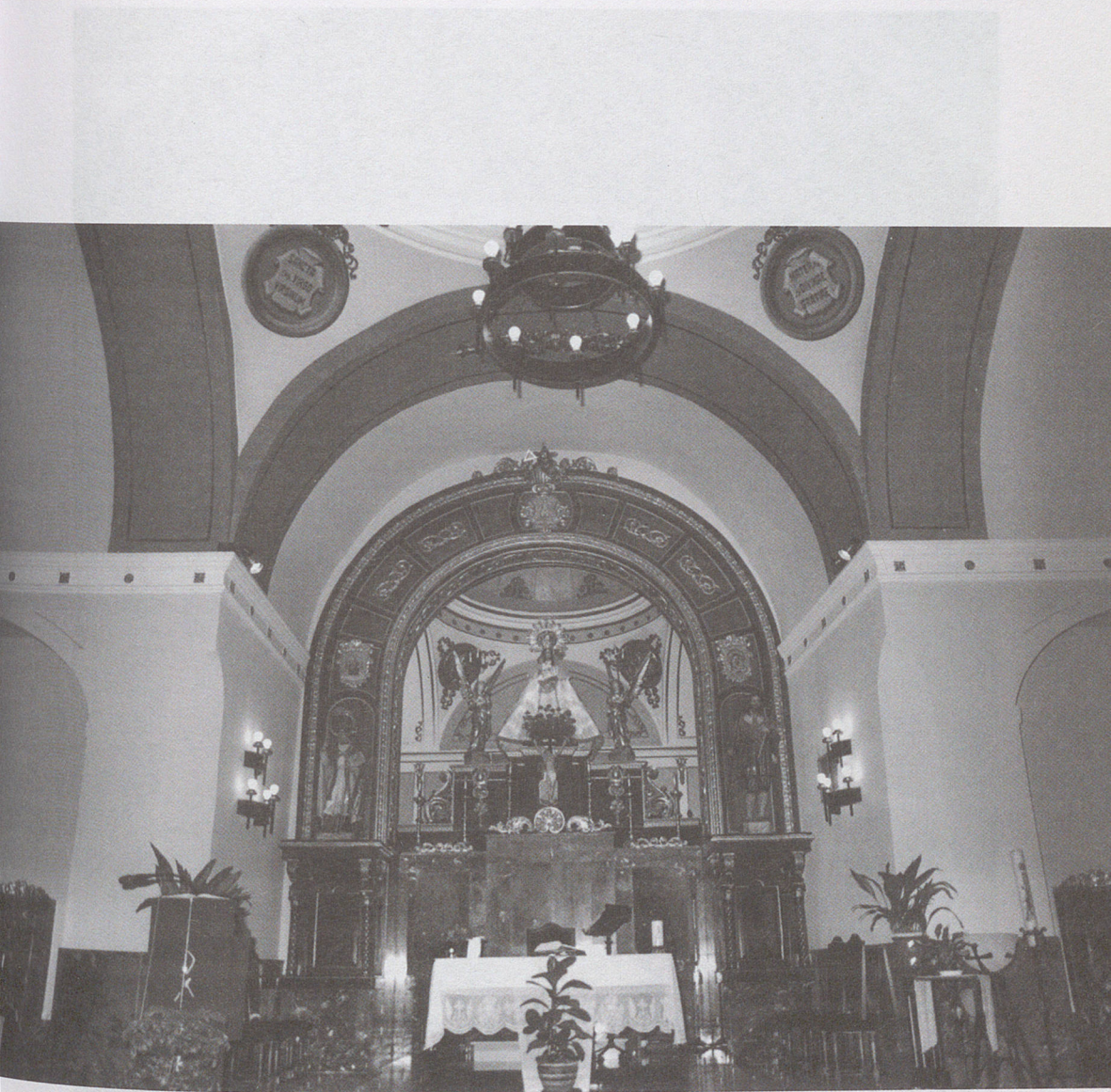
■ Vista actual de la cabecera de la Iglesia de Santa María del Castillo de Perales de Tajuña (Madrid).