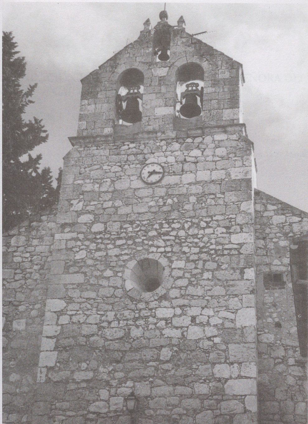
■ Espadaña situada a los pies del templo parroquial de Perales en la que se localizan las campanas.