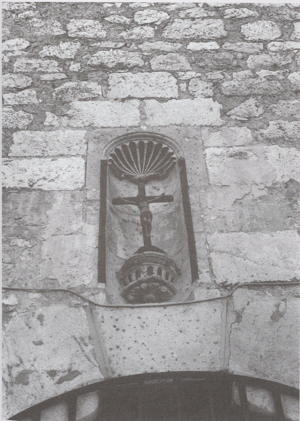
■ Hornacina avenerada sobre la puerta principal del templo.