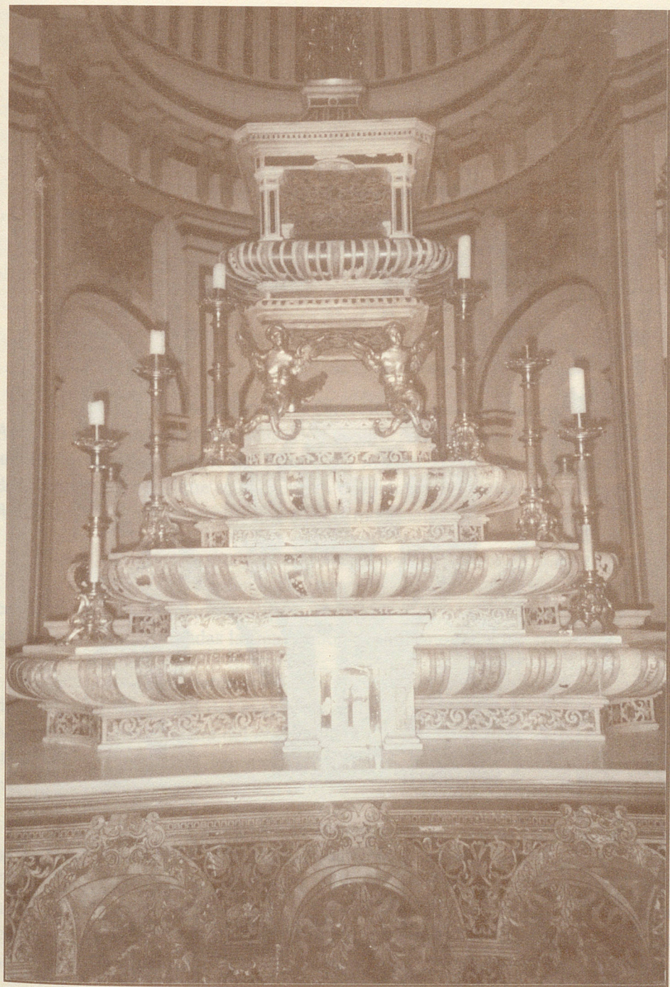
Altar baldaquino de la Capilla de San Fausto.