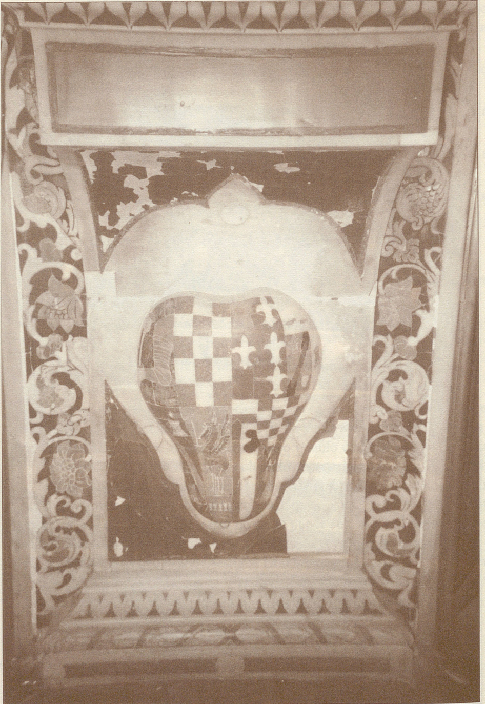
Detalles de la decoración heráldica.