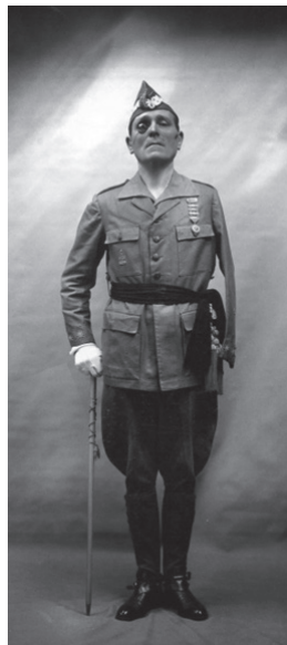
Foto 2. La Muerte del Fundador | José Millán-Astray - Legión Urbana Barcelona. Disponible en legionurbana.org/2016/07/la-muerte-del-fundador-jose-millan-astray/ visitado última vez 5/7/2019