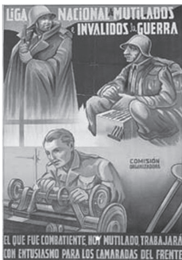
Foto 4. CARTELES GUERRA CIVIL ESPAÑOLA-2 - Anarquismo en imágenes. Disponible en https://anarquismo.jimdo.com/carteles-guerra-civil-española-2/ visitado ultima vez 5/7/2019