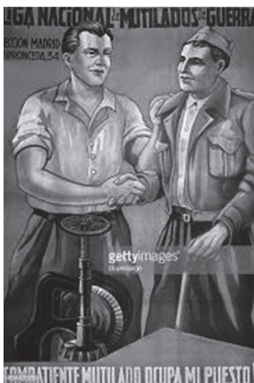
Foto 3. CARTELES GUERRA CIVIL ESPAÑOLA-2 - Anarquismo en imágenes. Disponible en https://anarquismo.jimdo.com/carteles-guerra-civil-española-2/ visitado ultima vez 5/7/2019