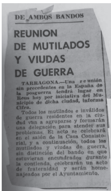
Foto 6. Recorte de un periódico de Tarragona indicando una reunión de los mutilados de ambos bandos