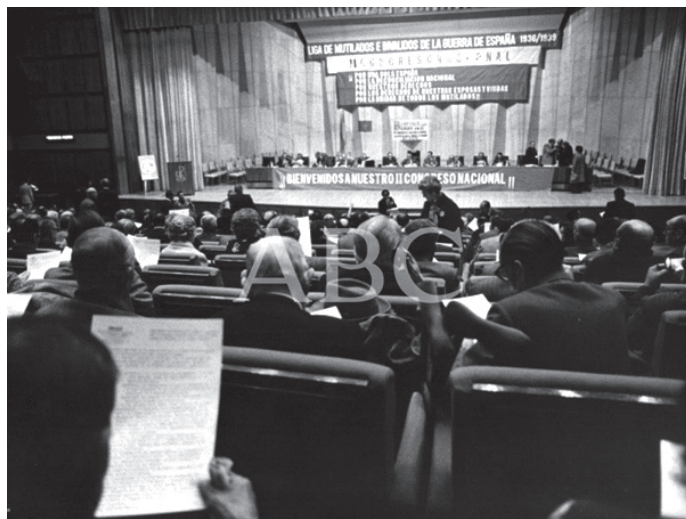
Foto 5. ABC. Edición Madrid 15/4/1977. II Congreso Nacional de la Liga de Mutilados de la Guerra de España