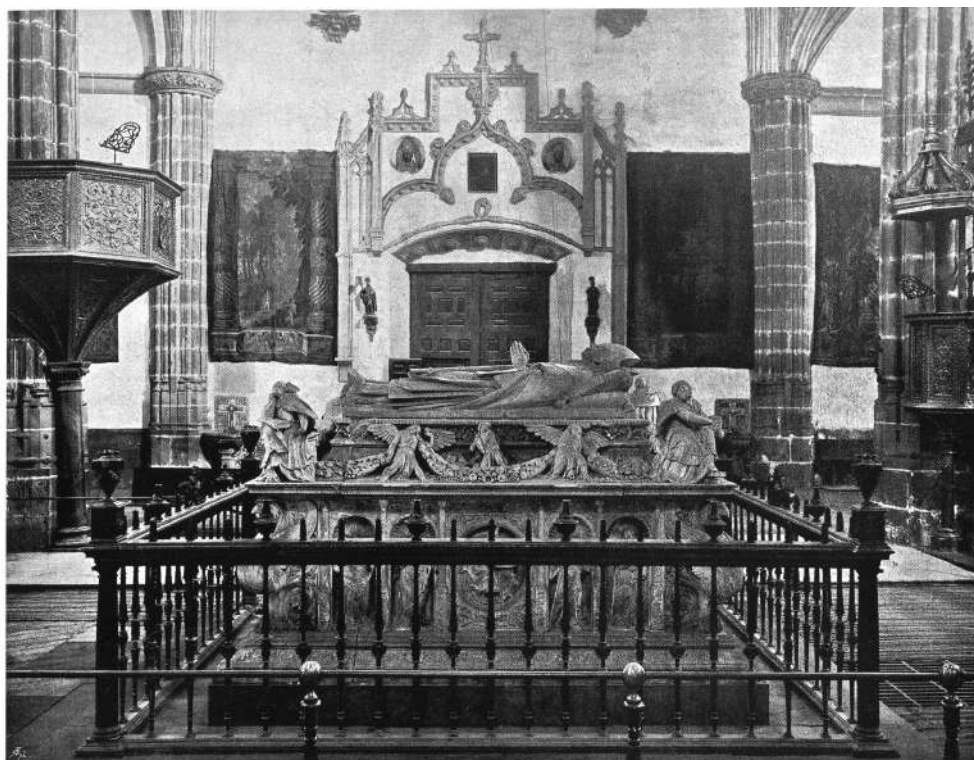
Figura 5. Anónimo. "San Camilo de Lelis", madera policromada, 90 cm de alto aproximadamente, hacia 1742, iglesia de los Agonizantes de Alcalá de Henares. Tras la desamortización de Mendizábal, la escultura se encontraba detrás del sepulcro del cardenal Cisneros en la Magistral, flanqueando la puerta de acceso por su lado derecho.