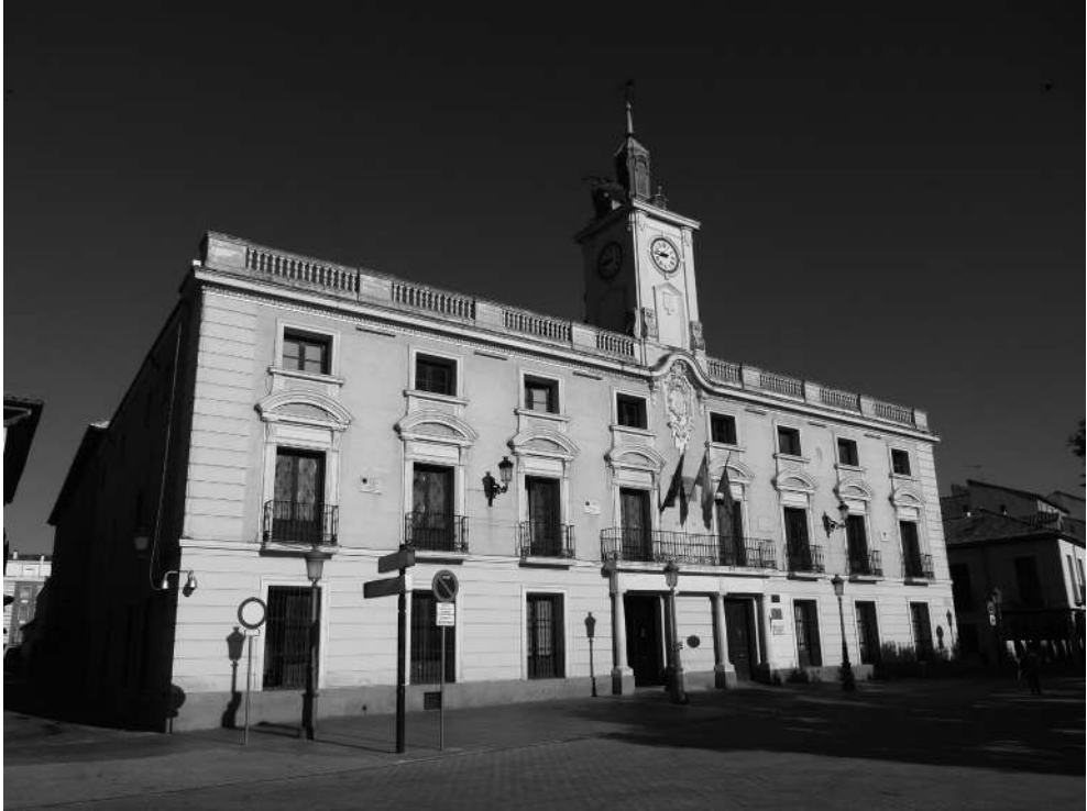
Figura 2. Colegio-Convento de los Clérigos Regulares Menores Ministros de los Enfermos, también conocidos como “Agonizantes”, “Camilos” o “Padres de la Buena Muerte”, su edificio presenta un enorme grado de transformación, actualmente ejerce como sede del Ayuntamiento de Alcalá de Henares (fotografía de Pablo Cano Sanz).