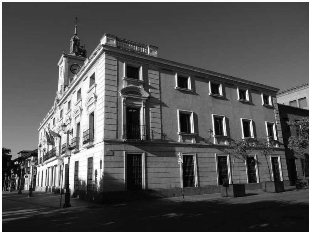
Figura 4. Vista lateral del Ayuntamiento de Alcalá de Henares, se corresponde relativamente con la iglesia de los PP. Agonizantes. El templo fue dividido en dos plantas, la baja actúa como dependencias administrativas y la zona alta como Salón de Plenos. La bóveda de este espacio sagrado fue destruida.