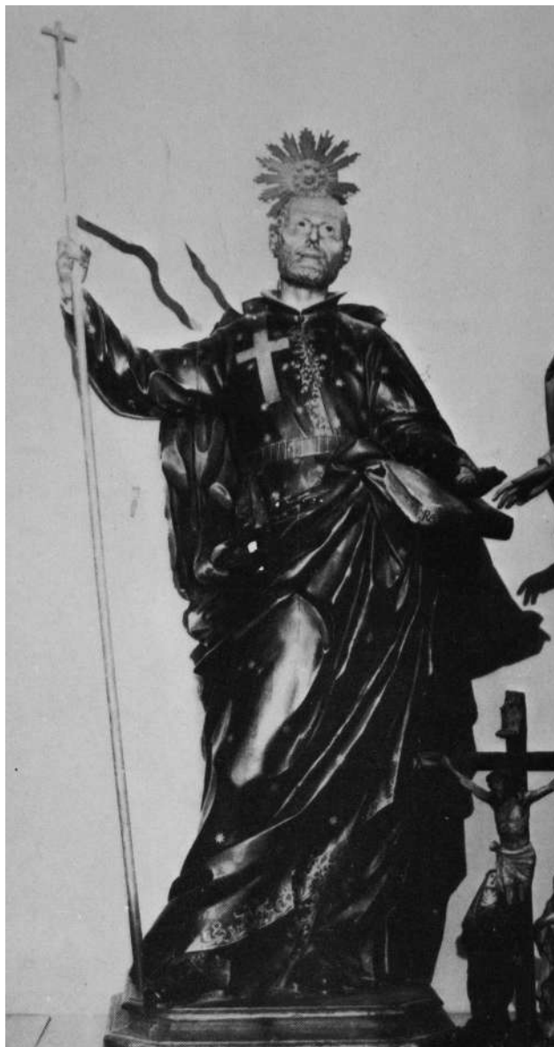
Figura 6. Anónimo. “San Camilo de Lelis”, madera policromada, tamaño ligeramente inferior al natural, mediados del siglo XVIII, esta obra procede del convento de los Agonizantes de la calle Fuencarral de Madrid, posteriormente pasó a la iglesia de san Antón y hoy se encuentra en el Museo de los PP. Escolapios de esa ciudad; dicha imagen devocional repite los mismos atributos iconográficos que el ejemplo de Alcalá de Henares (fig. 5).