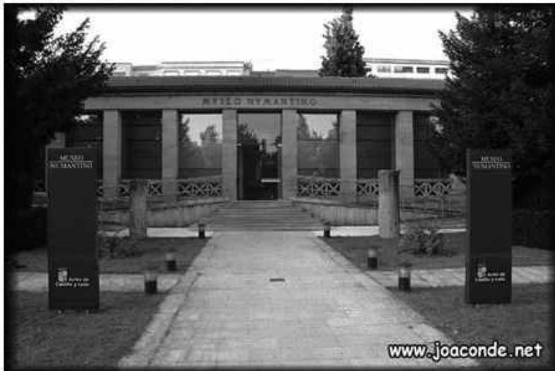
Fachada del Museo Numantino de Soria. Según diseño y construcción de Manuel Anibal Alvarez.