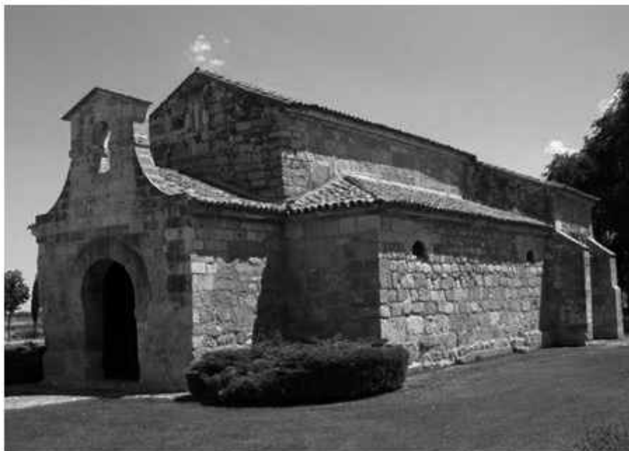
Colegiata de San Pedro de Cervatos (siglo XII) Santander. Restaurada por Manuel Anibal Alvarez Amoroso.