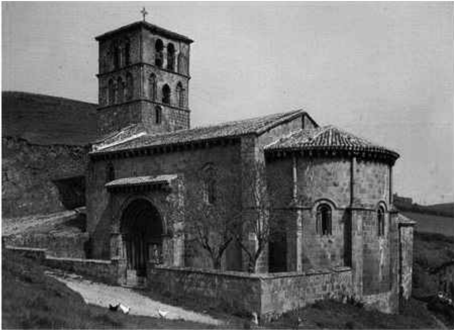
Basílica de San Juan de Baños. Palencia. Restaurada por Manuel Anibal.