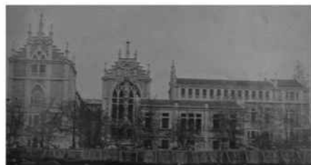
Panorámicas y planta del colegio del Pilar, cuyo proyecto, diseño y construcción corrió a cargo de Manuel Anibal Alvarez Amoroso, Fotografías publicadas, junto con otras en Arquitectura Española = Spanish Architecture nº 1 y 2, 1923.