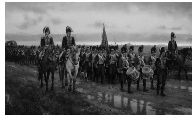
La salida de los zapadores de Alcalá en 1808. Augusto Ferrer Dalmau

Paraninfo y Salón de Actos del Rectorado de la Universidad de Alcalá Plaza de San Diego